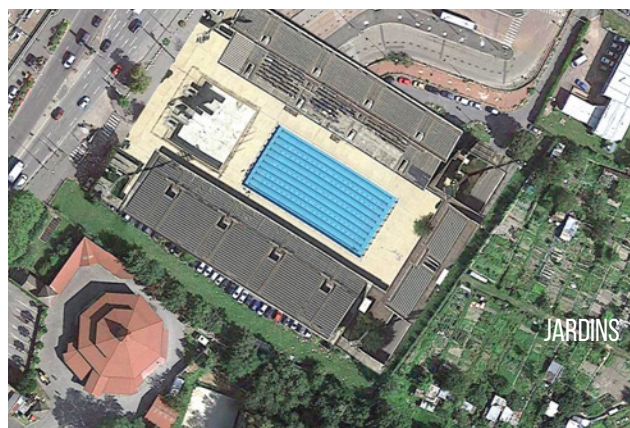
PISCINE DES JEUX OLYMPIQUES D'ATHENES