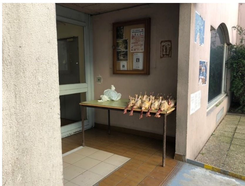
Un dimanche après-midi, au foyer Adef de Saint-Ouen. (JL)

Un accès au logement social a été ouvert. Début mars 2020, quinze résidents avaient signé un bail en HLM, trente-cinq autres étaient susceptibles d'en bénéficier. « C'est un investissement considérable , assure Anne Coste de Champeron, la sous-préfète de la Seine-Saint-Denis. Les « remplaçants » qui habitent dans la chambre d'autres titulaires sont inscrits sur la liste des relogés en modulaire. « Les JO ont permis de bien faire ce relogement , assure la représentante de l'État. Ce foyer était en très mauvais état. Des moyens ont été mis sur cette opération et l'accompagnement des résidents a été particulièrement soigné. Cette opération devait être exemplaire. »