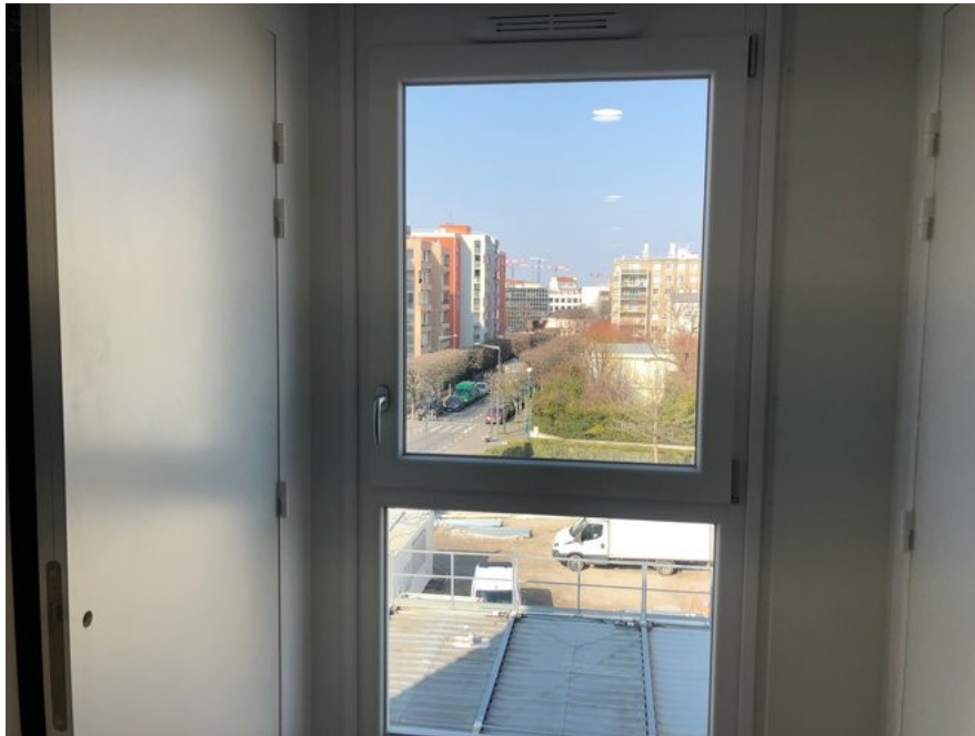
À l'intérieur d'une chambre des modulaires de la porte Montmartre, 29 février 2021. (JL)

Ce n'est pas le seul problème causé par ce déplacement. Les modulaires provisoires, tout comme les futurs logements en dur, sont conçus sur le mode de « la résidence » et non plus du foyer, comme la loi le requiert depuis 2013. Les chambres sont individuelles, sur le modèle de la studette étudiante. Il n'y a plus de cuisine collective ni de salle commune pour les repas.