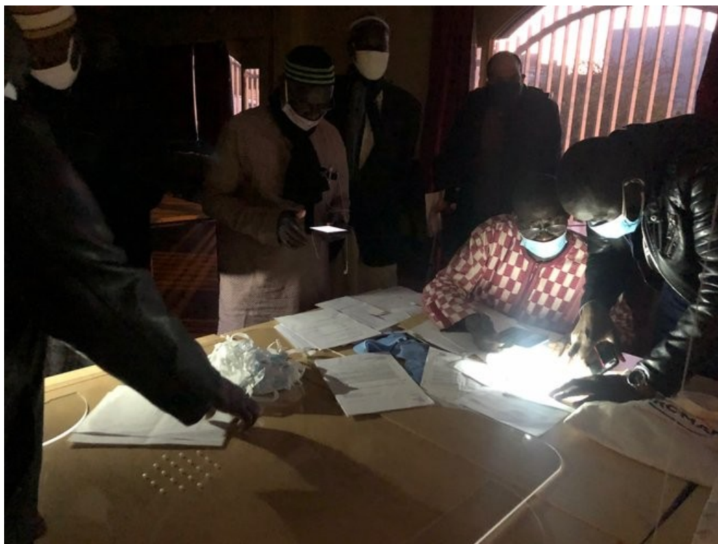
Réunion des résidents du foyer Adef de Saint-Ouen, 28 février 2021. (JL)

Une fois les jeux terminés, des locaux d'activités dédiés à la formation et à l'entrepreneuriat y sont annoncés, dans un quartier labellisé « biodiversité », avec beaucoup de végétation, des cuisines partagées et « des terrains de basket en toiture ».