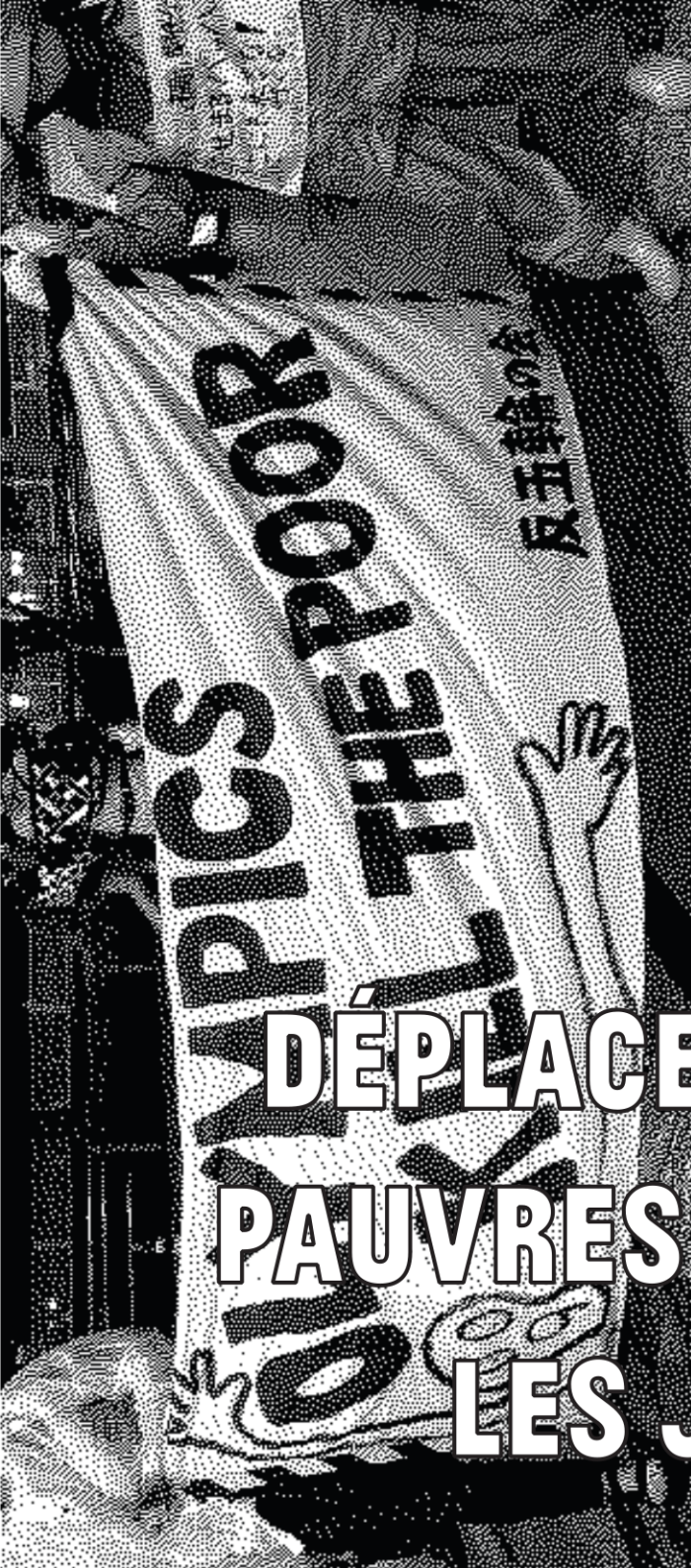
Banderoles des militant-e-s de No Olympics 2020