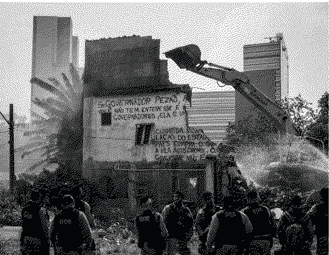
Destruction de la favela Vila Autodromo à Rio

était historiquement un quartier ouvrier assez pauvre. Les 425 habitant-e-s du lotissement de Clays Lane sont déplacé-e-s en 2007, pour permettre la construction du Parc Olympique. Avec les JOP, les loyers de Londres ont été multipliés par quatre.