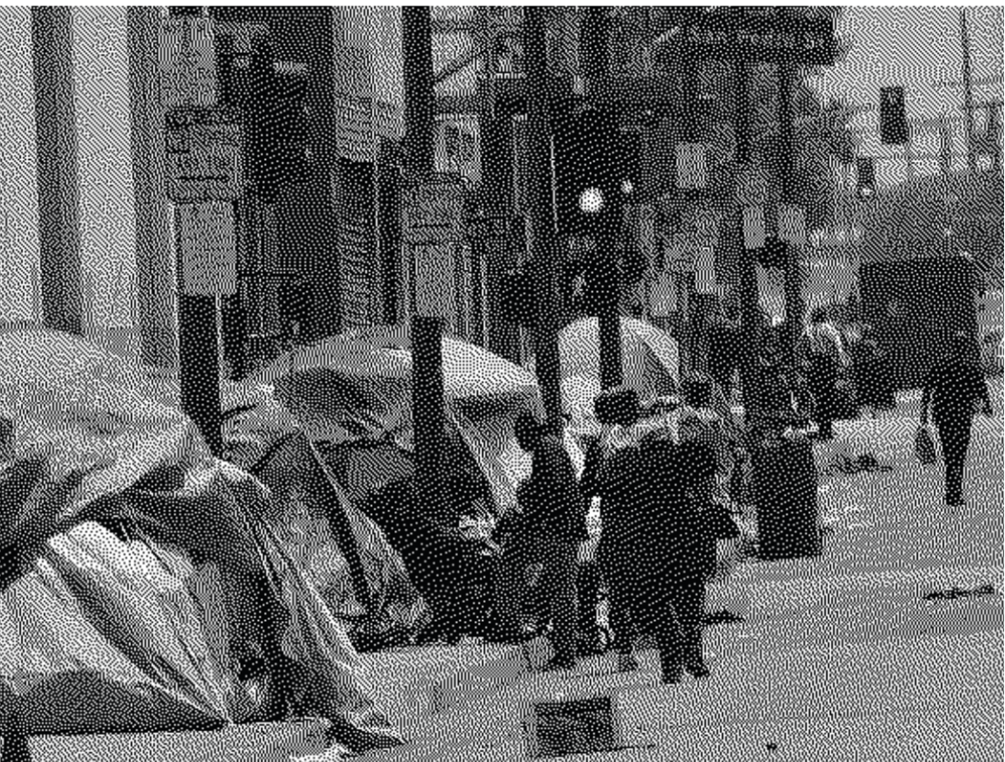
Un camp de sans-abris dans les rues de Los Angeles

Cette disparition des pauvres ne concerne pas seulement les 66 000 personnes sans foyer du comté de L.A, mais aussi les nombreux vendeurs de rue, les travailleurs du sexe, tous ceux qui participent à des économies informelles, les immigrants et les communautés BIPOC. Les promoteurs et les politiciens veulent qu'ils disparaissent tous, et les Jeux olympiques sont là pour accélérer, justifier et mettre un verni brillant sur leur projet de nettoyage ethnique.