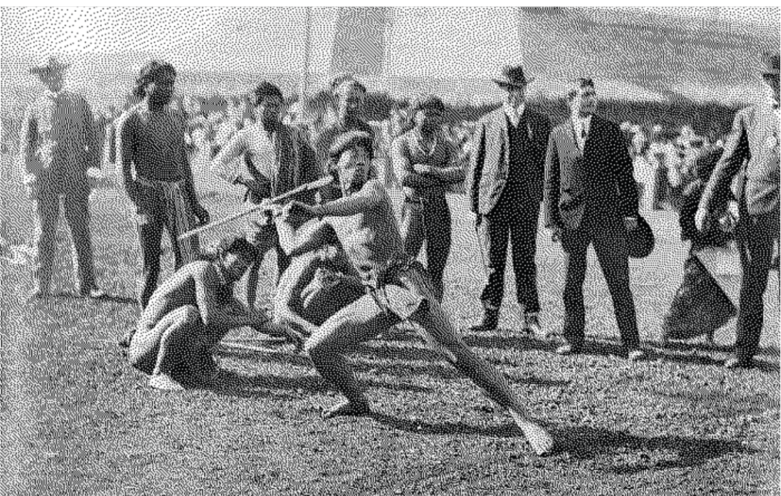
Un Igorot lançant une sagaie sous l'œil des blancs

Ces “Journées Anthropologiques” peuvent être vues comme une version sportive des zoo humains, qui commençaient à apparaître un peu partout en Occident.