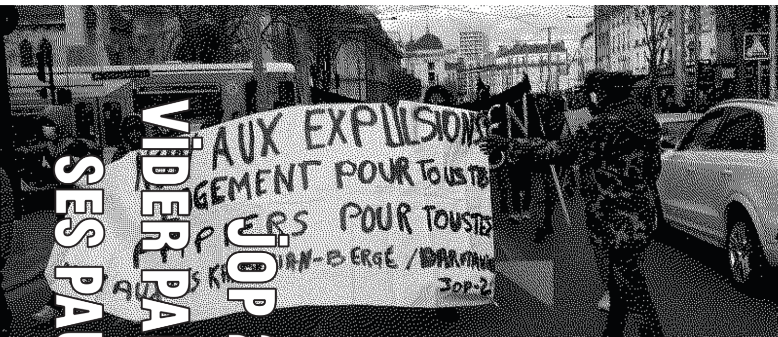
Manifestation contre l'expulsion du squat Unibéton